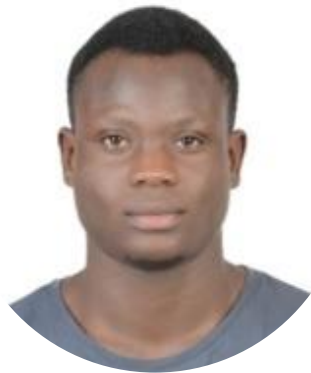
22 ans Aviron Togo