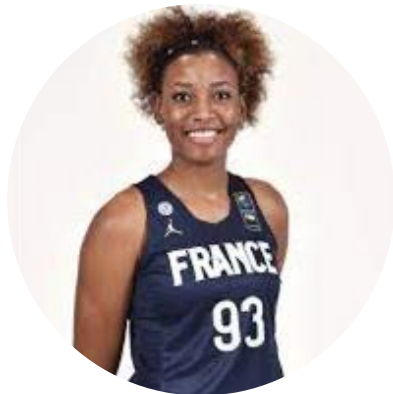
30 ans Basketball Cameroun