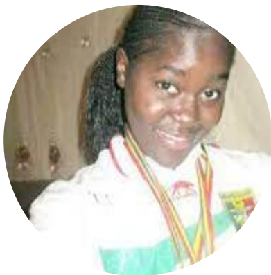
29 ans Karate Mali