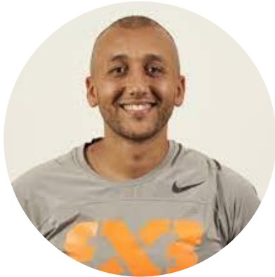
32 ans Basketball Maroc