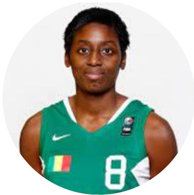
38 ans Basketball Mali