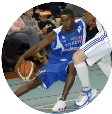
40 ans Basketball Sénégal