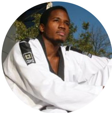
26 ans Taekwondo Mali