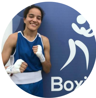
26 ans Boxe anglaise Mali