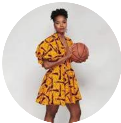
24 ans Basketball République Centrafricaine