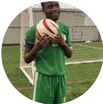
25 ans Cécifoot non voyant Mali