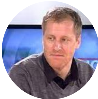
41 ans Volley-ball