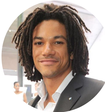
36 ans Para-athlétisme