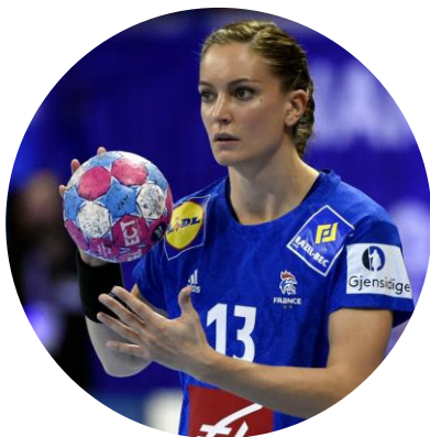
29 ans Handball