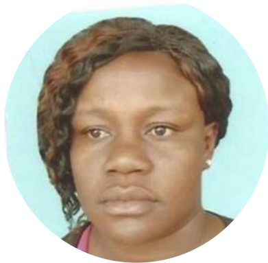
35 ans Judo Burkina Faso