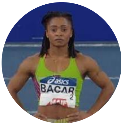
28 ans Athlétisme Mali