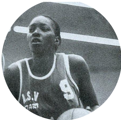
59 ans Basketball Sénégal