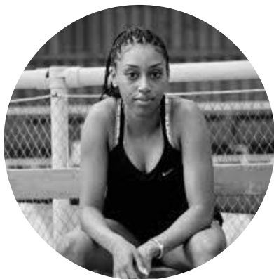
27 ans Athlétisme