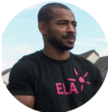
36 ans Judo