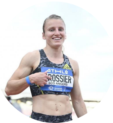
26 ans Athlétisme