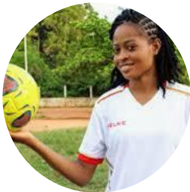
25 ans Football Bénin