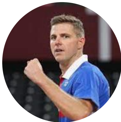
35 ans Badminton